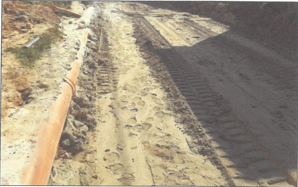
VISTA FOTOGRÁFICA N° 04: COLOCACIÓN DE GEOMALLA Y GEOTEXTIL EN CALLE LAGUNAS TRAMO II.