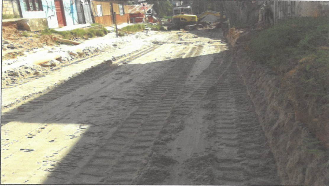
VISTA FOTOGRÁFICA N° 02 : COLOCACIÓN DE GEOMALLA Y GEOTEXTIL EN CALLE LAGUNAS TRAMO II.