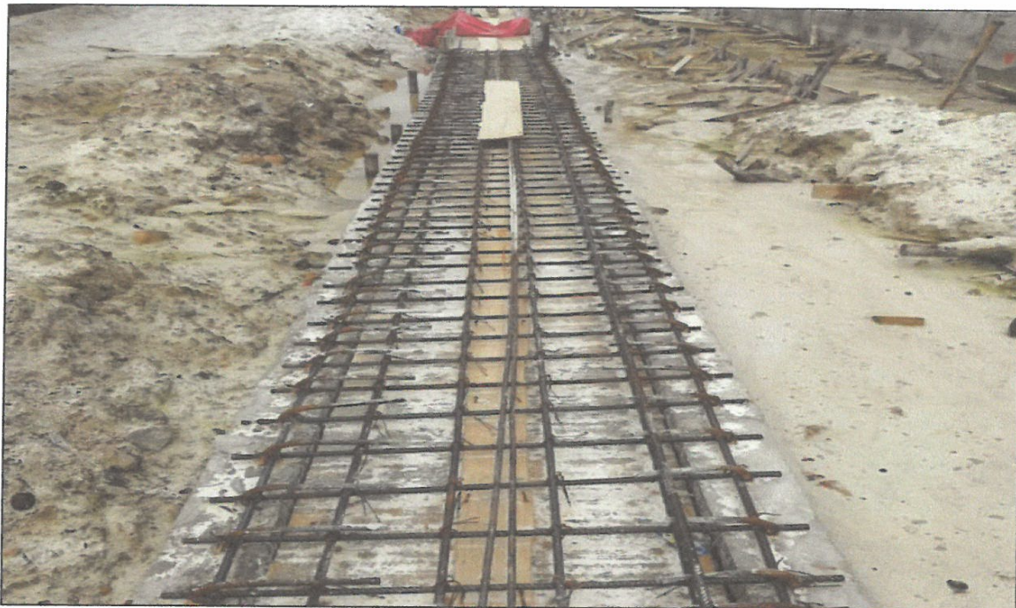
VISTA FOTOGRÁFICA N° 12: VACEADO DE MORTERO f'c= 210 kg/cm2 EN MUROS DE CANAL DE ALCANTARILLADO EN CALLE SALAVERRY.